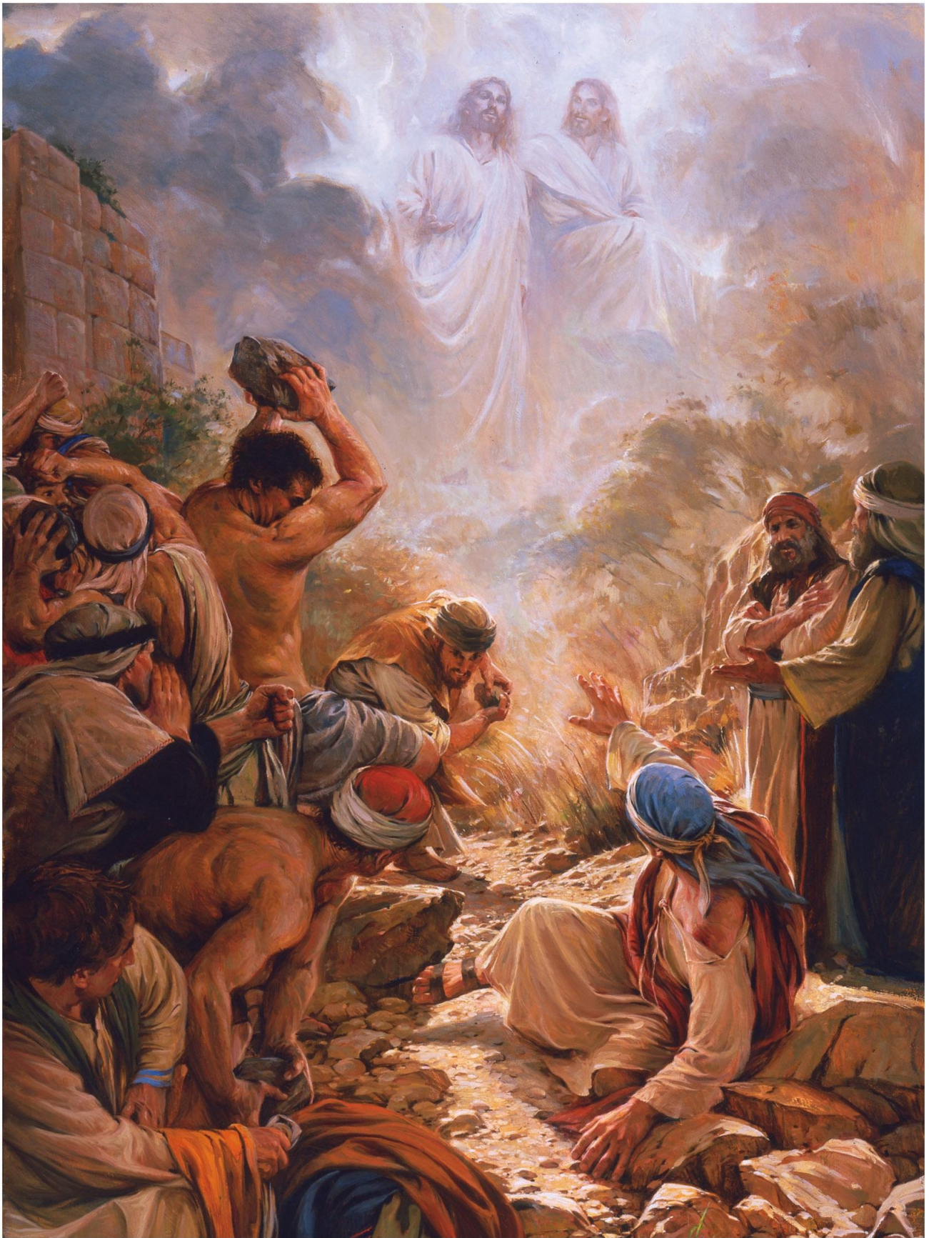
I See the Son of Man Standing on the Right Hand of God, by Walter Rane